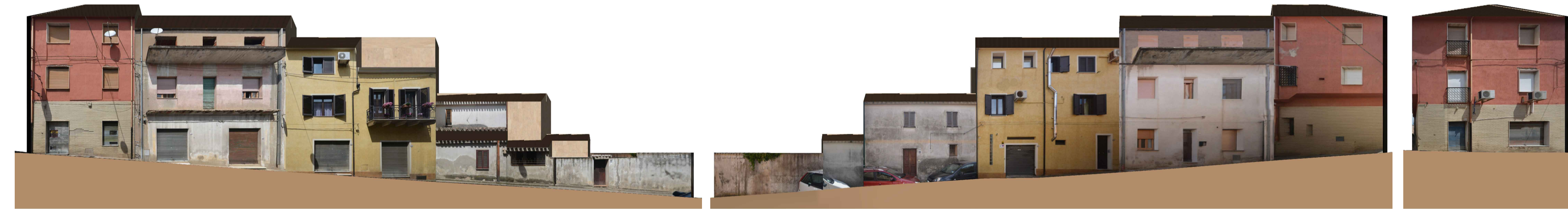
PROFILO A _ A Via Roma