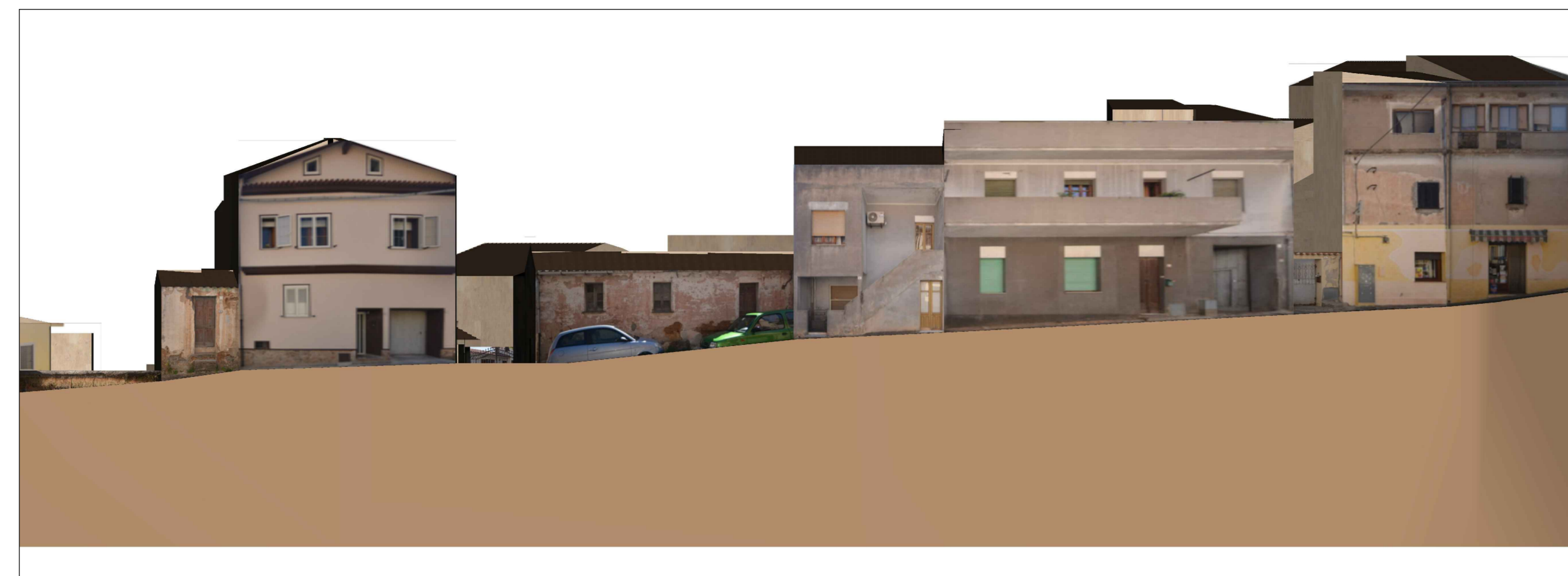
PROFILO B - B Via Garibaldi