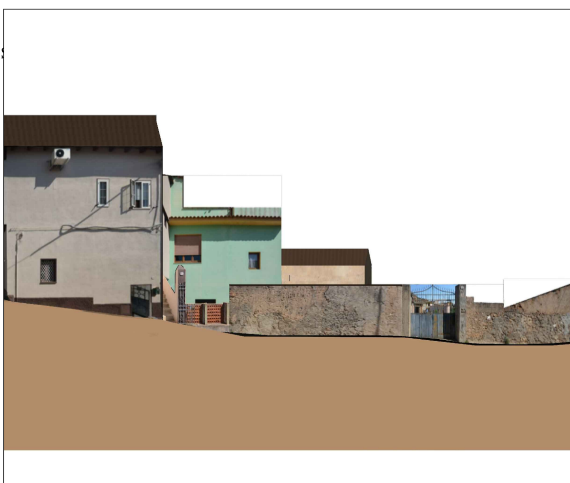
PROFILO A - A Via Garibaldi Vico