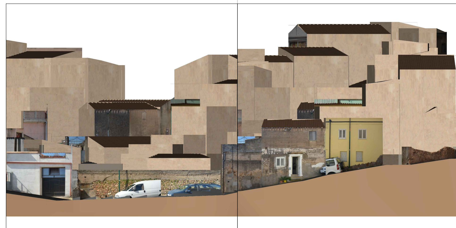
PROFILO A - A Via E. Lussu