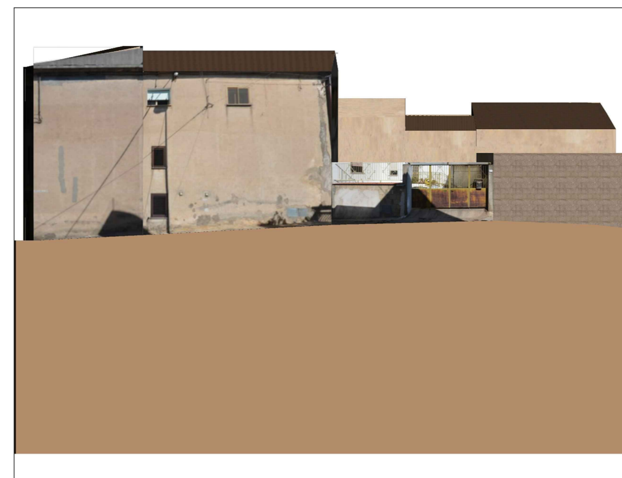
PROFILO C - C Via Garibaldi Vico