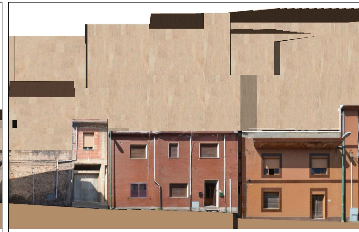
PROFILO C _ C Via Convento