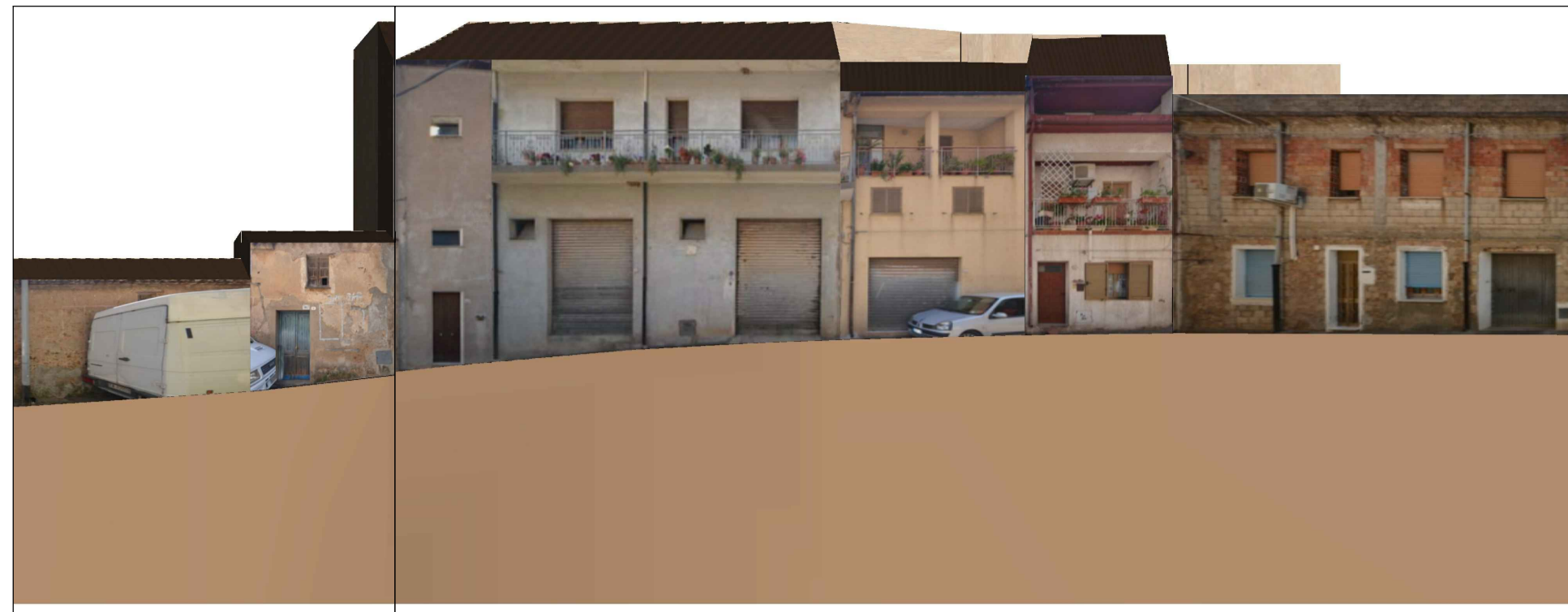
PROFILO A _ A Via Scuole